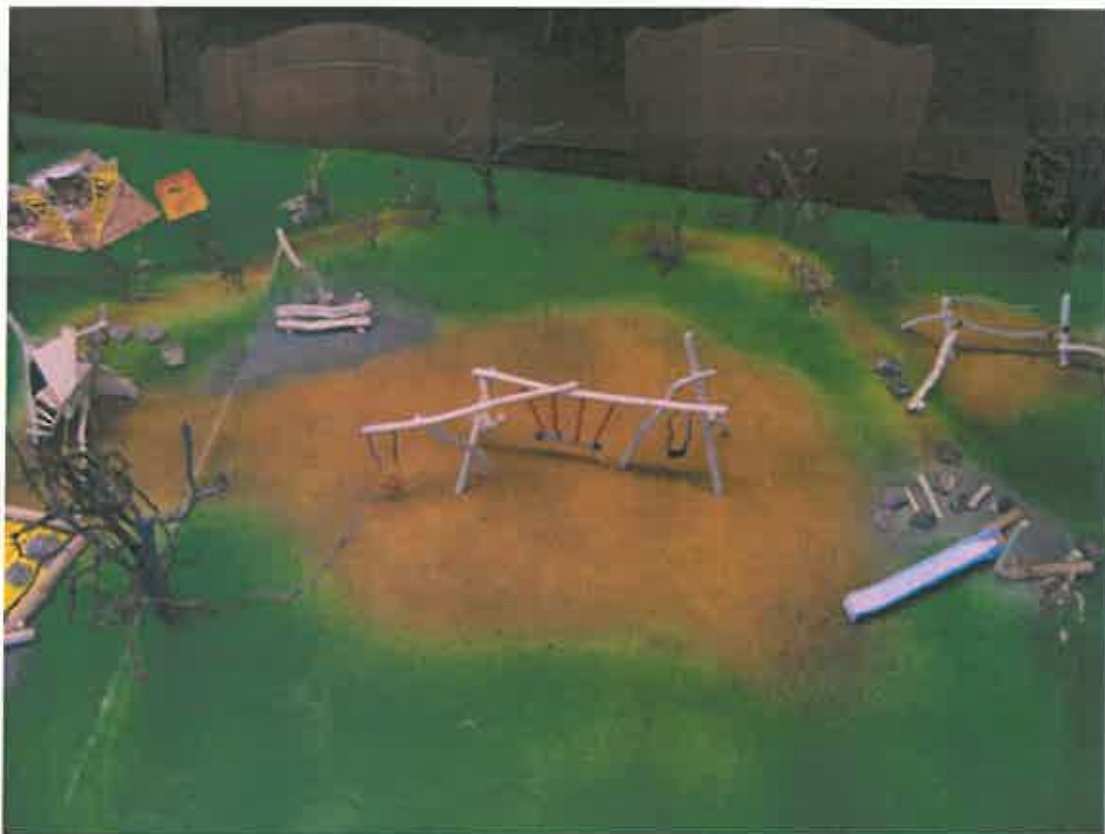
Abb. 5: mittlerer Bereich mit Trioschaukel