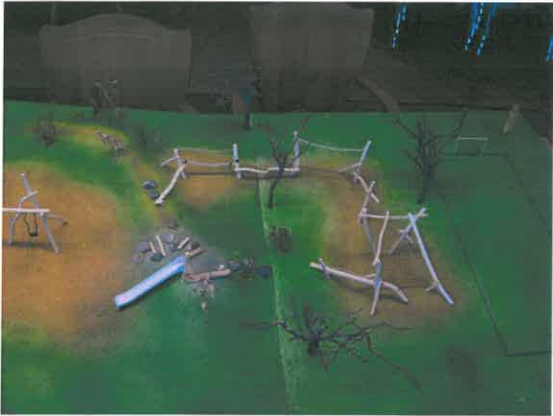
Abb. 4: südlicher Bereich mit Bolzplatz, Klettersteig, Netzkletterei und Rutsche