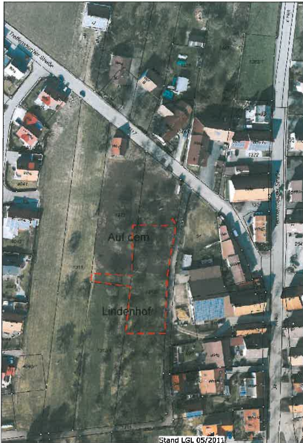
Abb. 2: Luftbild-Übersicht