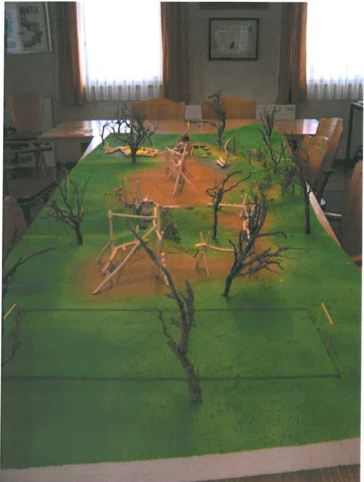
Abb. 3: Gesamtansicht der Planung