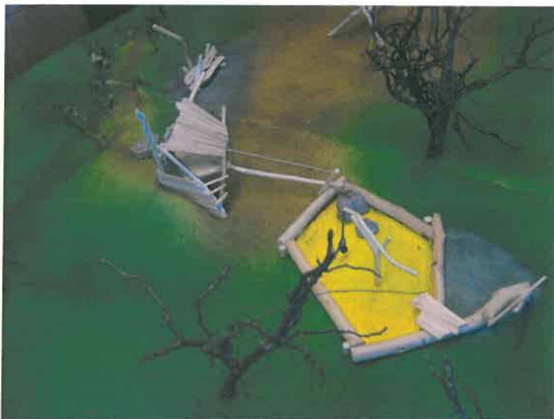
Abb. 6: nördlicher Bereich mit Sandspielbereich mit Drehkran, Unterschlupf und Ausguck